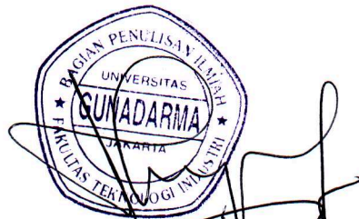
(Meilani B. Siregar, Skom, MMSi)