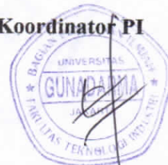
Meilani B Siregar, SKom.,MMSI