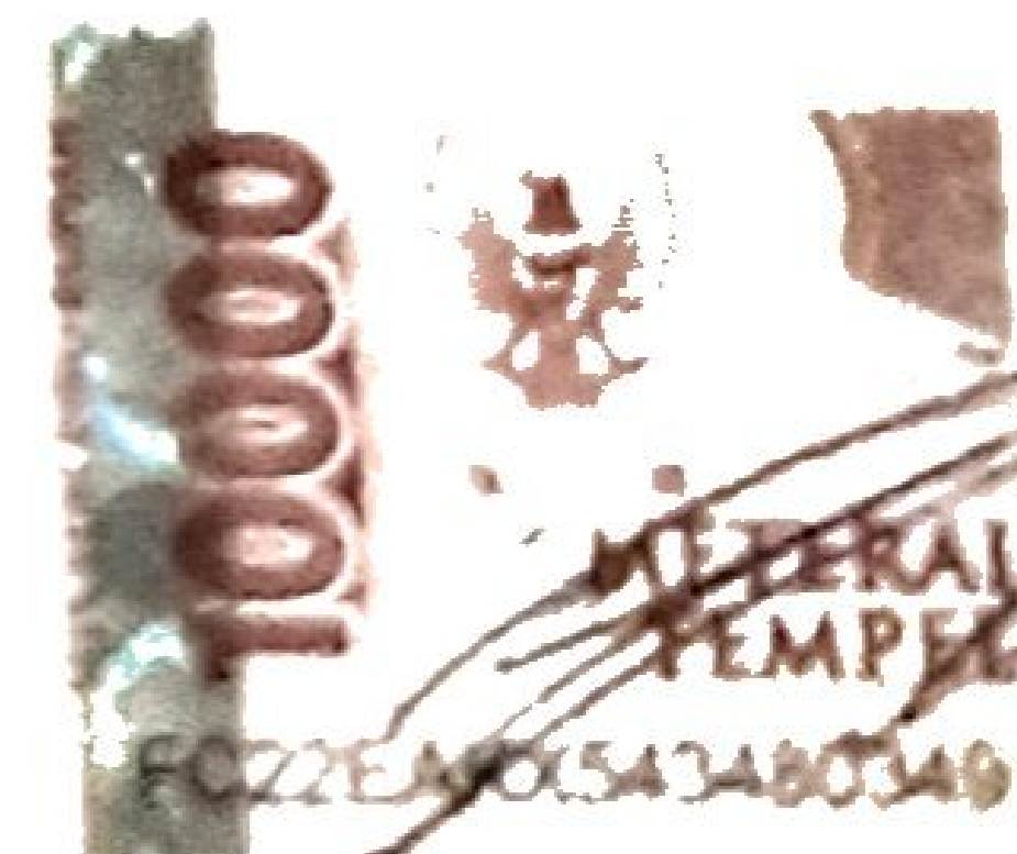
Tri Pramudita Erlangga